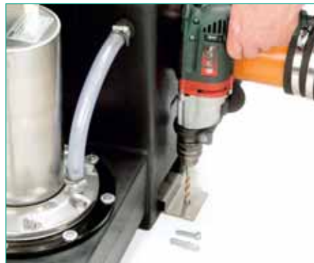
Assembly anti-buoyancy safeguard