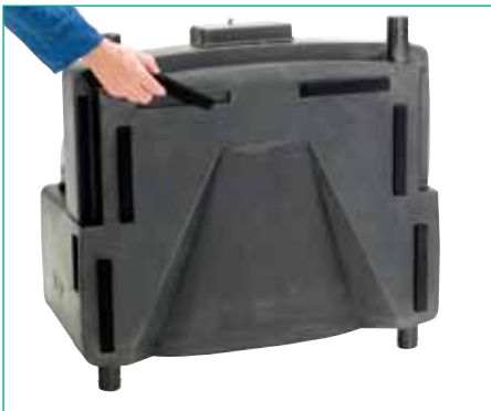
Assembly dampening strips